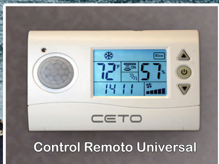
Control Remoto Universal