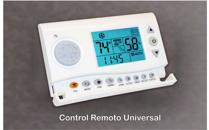
Control Remoto Universal

CETO puede ser configurado e instalado en menos de 5 minutos sin conexión de ningún tipo.